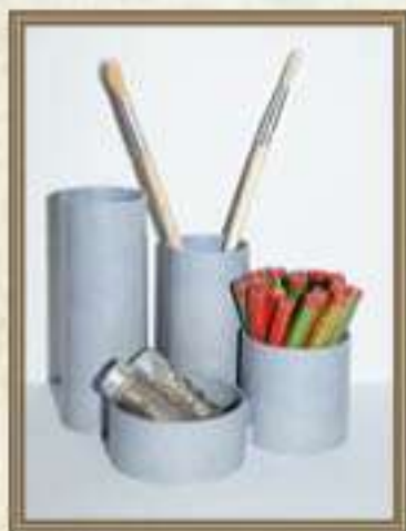
Подставка для ручек и карандашей