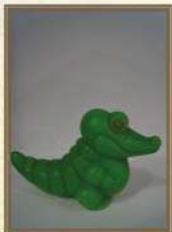
Пластмассовая игрушка «Крокодил»

Игрушка представляет собой белого гуся с вытянутой шеей, лапки и клюв окрашены в красный цвет, глаза черного цвета. Присутствуют следы эксплуатации игрушки.