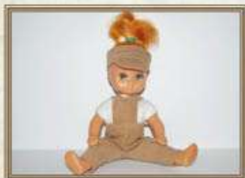
Кукла СССР 1970-90-е гг. Высота – 20 см. Количество – 1 экз.