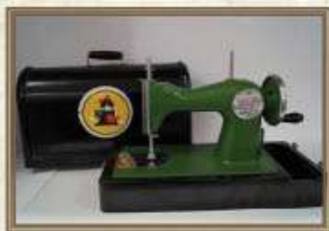
Детская швейная машинка «Светоприбор» ДШМ 1 БССР, г. Минск, завод «Светоприбор» 1940-1980гг.

Размеры 25*11*18 см Цена – 5р.20 коп. Количество -1. Отсутствует крышка отсека для швейных принадлежностей. Детская швейная машинка «Светоприбор» ДШМ 1 выпускалась на минском светотехническом заводе с конца 40х годов XX века. Все игрушечные швейные машинки, выпускаемые на этом заводе, имели литой стальной корпус и основание из карболита, или дерева. Дизайн моделей был практически одинаковый, с некоторыми изменениями в расположении катушечного держателя. Детские машинки, в своём дизайне были копиями взрослых швейных машин. Функционал детской швейной машинки – простая одноцепочная строчка.