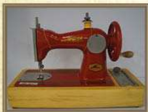
Детская швейная машинка ДШМ-2

Без видимых повреждений. В конце 70-х годов стали появляться машинки другого дизайна. У таких машинок могло быть несколько операций, они шили и зиг-загом и обычным швом. Их корпус был уже пластиковый. Некоторые модели стали выпускать с ножным приводом. К машинке прилагалась инструкция на двух языках – русском и немецком, а также фирменная коробка. На данной модели уже имеется электромеханический привод, а также защита на лапках от ранения пальцев и освещается рабочая зона у швейной иглы.