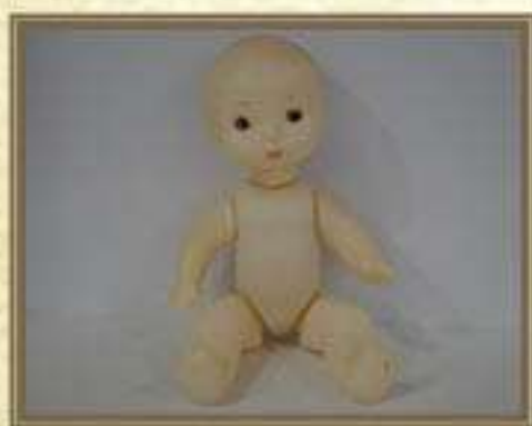
Кукла СССР 1970-90-е гг. Высота – 15 см. Количество – 1 экз.