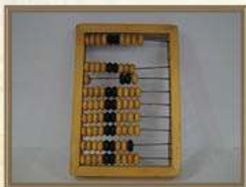
Счеты малые ученические

Карандашница зеленого цвета, выполненная в виде ежика со шляпой.