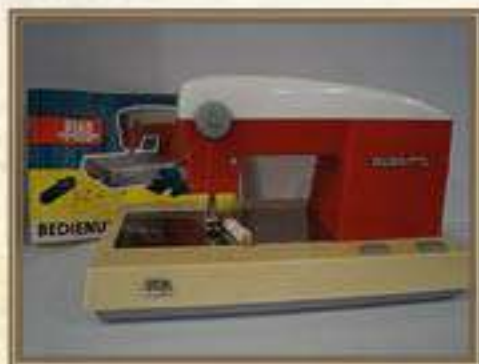
Детская швейная машинка «PIKO Elektra»

Размеры 25*11*18 см Цена – 5р.20 коп. Количество -1. Отсутствует крышка отсека для швейных принадлежностей. Детская швейная машинка «Светоприбор» ДШМ 1 выпускалась на минском светотехническом заводе с конца 40х годов XX века. Все игрушечные швейные машинки, выпускаемые на этом заводе, имели литой стальной корпус и основание из карболита, или дерева. Дизайн моделей был практически одинаковый, с некоторыми изменениями в расположении катушечного держателя. Детские машинки, в своём дизайне были копиями взрослых швейных машин. Функционал детской швейной машинки – простая одноцепочная строчка.