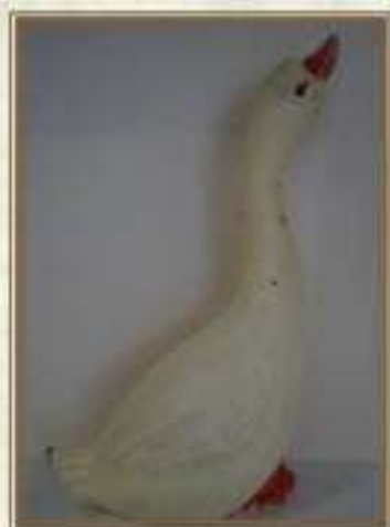
Пластмассовая игрушка «Гусь (кольцеброс)» СССР, г. Киров, ПО Вятка (фабрика игрушек «Весна») 1970-1980-е гг.