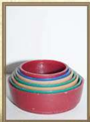
Пластмассовая игрушка «Пирамидка»

Игрушка в виде зеленого крокодила с рельефным узором и глазами, окрашенными в оранжевый цвет.