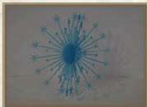
Елочная игрушка «Снежинка» СССР, г. Тула, кооператив «ИСТОК» 1980-90-е гг.

Высота – 5 см. Цена – 25 коп. Количество – 5 экз. Объемная полиэтиленовая игрушка в виде снежинки голубого цвета. В сохранном виде.