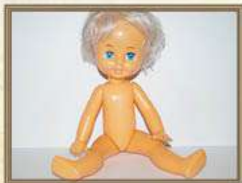
Кукла СССР 1970-90-е гг. Высота – 25 см. Количество – 1 экз.