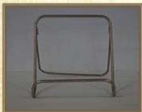
Подставка для книг

Корпус счетов выполнен из дерева и покрыт лаком, 9 металлических стержней, деревянные костяшки, окрашенные бесцветным лаком и краской черного цвета. На корпусе счетов присутствуют следы эксплуатации.